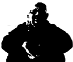
مؤلف الكتاب، وقد ، حشر ، صورته بين صور ، صناعية مصر .