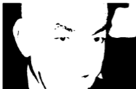
اللواء أحمد رشدي، صناعي الأمن والانضباط