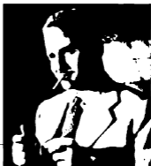
علوي الجزائر، صناعي شاي الشيخ الشريب والكوكاكولا