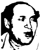
أبو رجيلة: صنايعي الحرب والأتوبيسات وكرة القدم