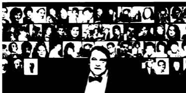
عاطف منتصر، صناعي الكاسيت وأغاني مصر الجديدة