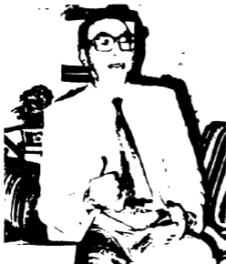
سعد لبيب، صناعي تلفزيون مصر