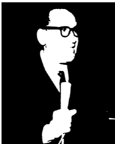
النَّبوي المهندس، صناعي صحبة مصر