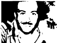
وجيه أياظة، سنايحي .شغلانة .المحافظ